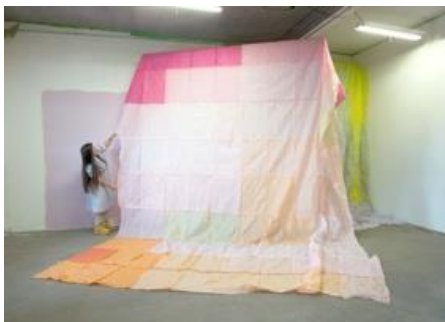
Dual 8 , 2022

Dual 8 , un immense patchwork de papier de soie (7m x 5 m), cousu par l'artiste, sera découpé lors d'une performance et transformé en palette de couleur : un ensemble de petites briques en papier. Pour l'artiste à l'esprit mathématique et généreux, chacune d'elles représente une unité du temps – passé à son assemblage et son dépeçage – qu'elle redistribue.