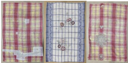
... de torchons et de serviettes, 2020-2022

Un ensemble de torchons de cuisine suspendus au plafond. Aux formes, motifs, et cicatrices variées, aux couleurs délavées, ces pièces de tissu furent récupérées par l'artiste auprès de quelques foyers de la commune normande d'Yvetot, avant d'être reprises. Elles se retrouvent démunies de toute fonction et n'incarnent désormais plus que le souvenir.