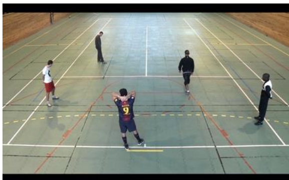
Attempt of Redemption , 2012

Attempt of Redemption (2012-2013), vidéo réalisée avec des détenus de la prison d'Écrouves en Lorraine.