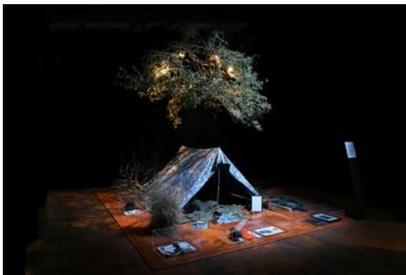
Installation à 100% L'expo, Grande Halle de la Villette, 2022

Installation-performance invitant à la dégustation autour d'une fontaine conviviale. Des plantes incrustées dans le cuir, à celles infusant le spiritueux cérémonieusement versé, c'est un concentré d'une forêt-refuge que Joël Harder introduit dans l'espace d'exposition. En séduisant nos papilles l'artiste partage l'intimité d'un lieu de drague secret, ayant animé un important cycle de son travail. Avant d'être savourée collectivement, c'est en collaboration avec la distillerie Helvia que la boisson est concoctée, à partir de plantes récoltées au sein d'un écosystème menacé.