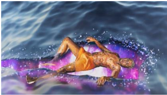
Alpha , peinture sonore, 2021

Kiddy Smile , peinture sonore, 2022, Kiddy Smile est un célèbre chanteur, DJ, producteur et performeur de la scène queer .