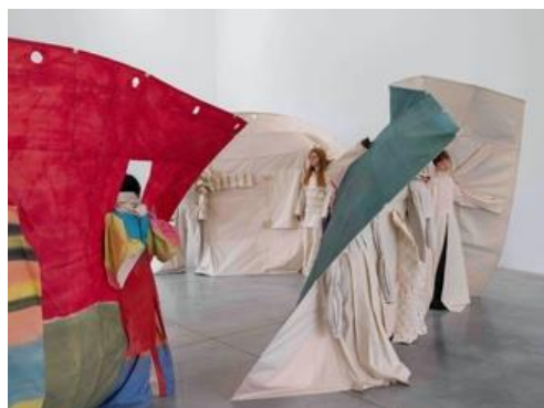
Skinscapes , 2021, sculptures et performance

Cinq masques se reflètent dans les miroirs des coulisses du studio photo et invitent les visiteurs à les revêtir, à une forme de participation individuelle, qui tranche avec les performances collectives que l'artiste chorégraphie généralement.