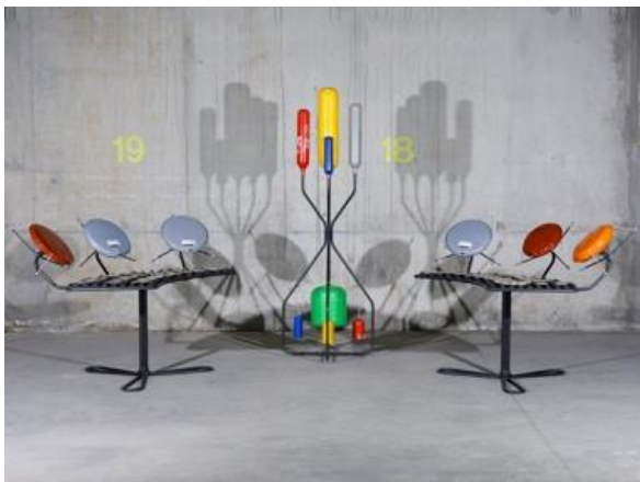
Vases d'expansion , 2021

Vases d'Expansion (2021), bouteilles de plongée, bonbonnes de gaz et extincteurs multicolores, assemblés en « sculpture sonore » activée en performance par le percussionniste Charles Dubois.