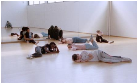
Lagoon , 2021

Lagoon , film 16mm, 2021. Travail avec des élèves d'un collège, autour des rêves, des gestes, des sons. Projet initié par l'ADAGP et mis en œuvre par Le BAL.